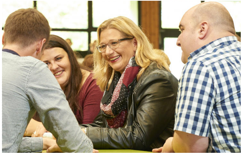
Anke Rehlinger, stellvertretende Landesvorsitzende der SPD Saar, im Gespräch mit Jungsozialisten

Ich bin davon überzeugt, dass es in einer modernen Gesellschaft möglich sein muss, dass zwei Menschen unabhängig vom Geschlecht aus freien Stücken Verantwortung füreinander